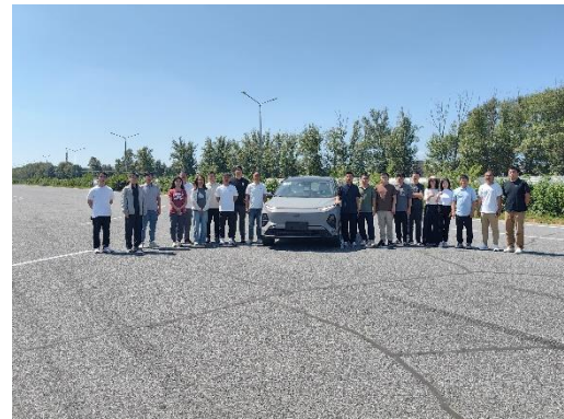
图1 功能安全试验验证